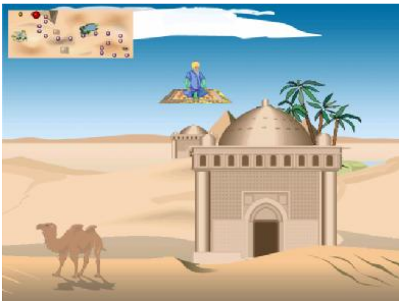
Рис. 2. Один из этапов («Полет на ковре-самолете») многоуровневой игровой БОС-процедуры. Регуляция физиологических показателей управляет высотой и скоростью полета «ковра-самолета», а задачей испытуемого является максимальное быстрое перемещение из одного пункта в другой. Его перемещение отражается положением на карте в левой верхней части окна.

вание в широкой психологической практике современных методов немедикаментозной коррекции и реабилитации различных психосоматических расстройств, стрессовых состояний, перегрузок.